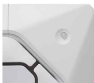
Senzor lidské přítomnosti (volitelný)

V případě odchodu osob z místnosti se jednotka přepne do úsporného provozu. Je možné nastavit dva různé režimy.